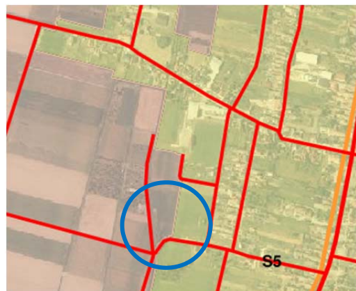
Prijedlog plana za ponovnu raspravu (listopad 2025.)