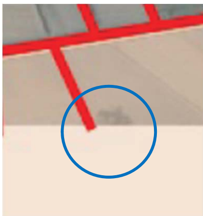
Prijedlog plana za javnu raspravu (srpanj 2025.)