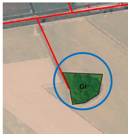
Prijedlog plana za ponovnu raspravu (listopad 2025.)