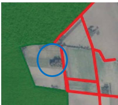
Prijedlog plana za javnu raspravu (srpanj 2025.)