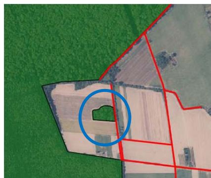
Prijedlog plana za ponovnu raspravu (listopad 2025.)