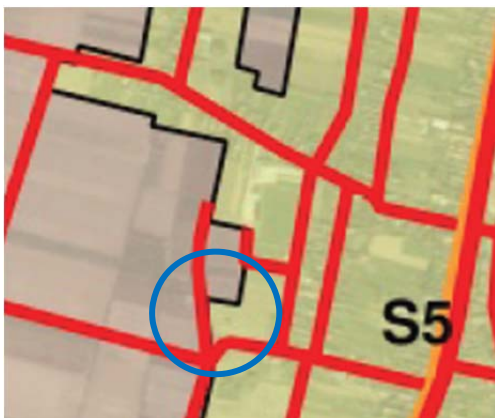
Prijedlog plana za javnu raspravu (srpanj 2025.)