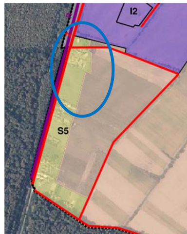
Prijedlog plana za ponovnu raspravu (listopad 2025.)